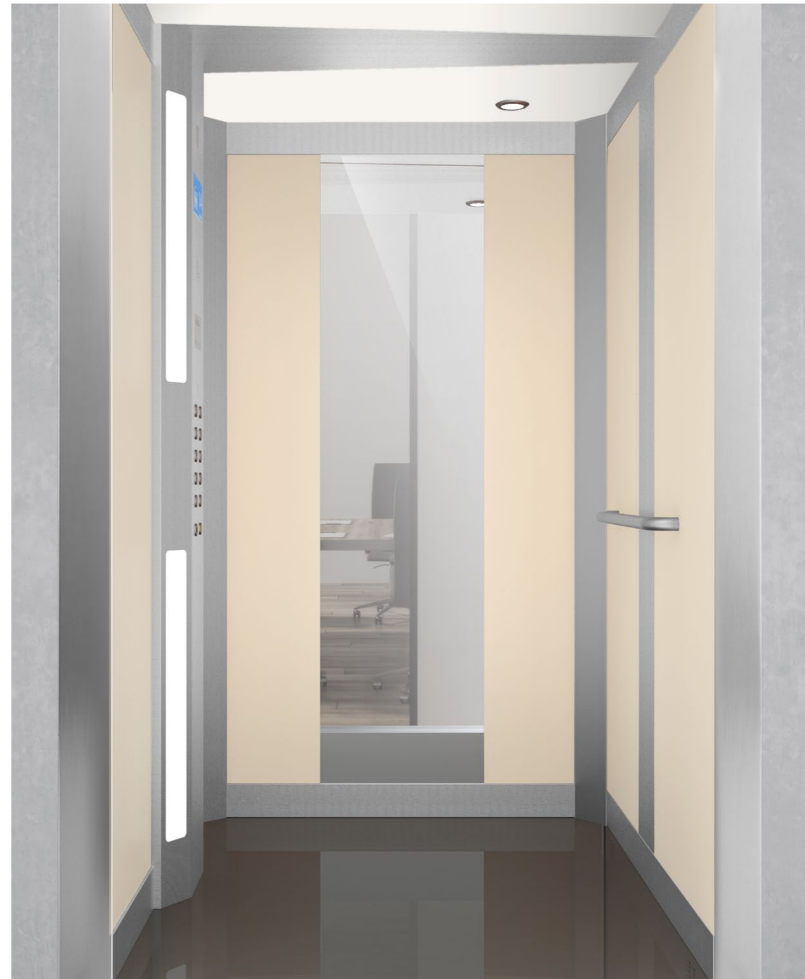
Cabina con acabados incluidos en precio base del modelo. / Cabin with finishes included in the base price of the model.