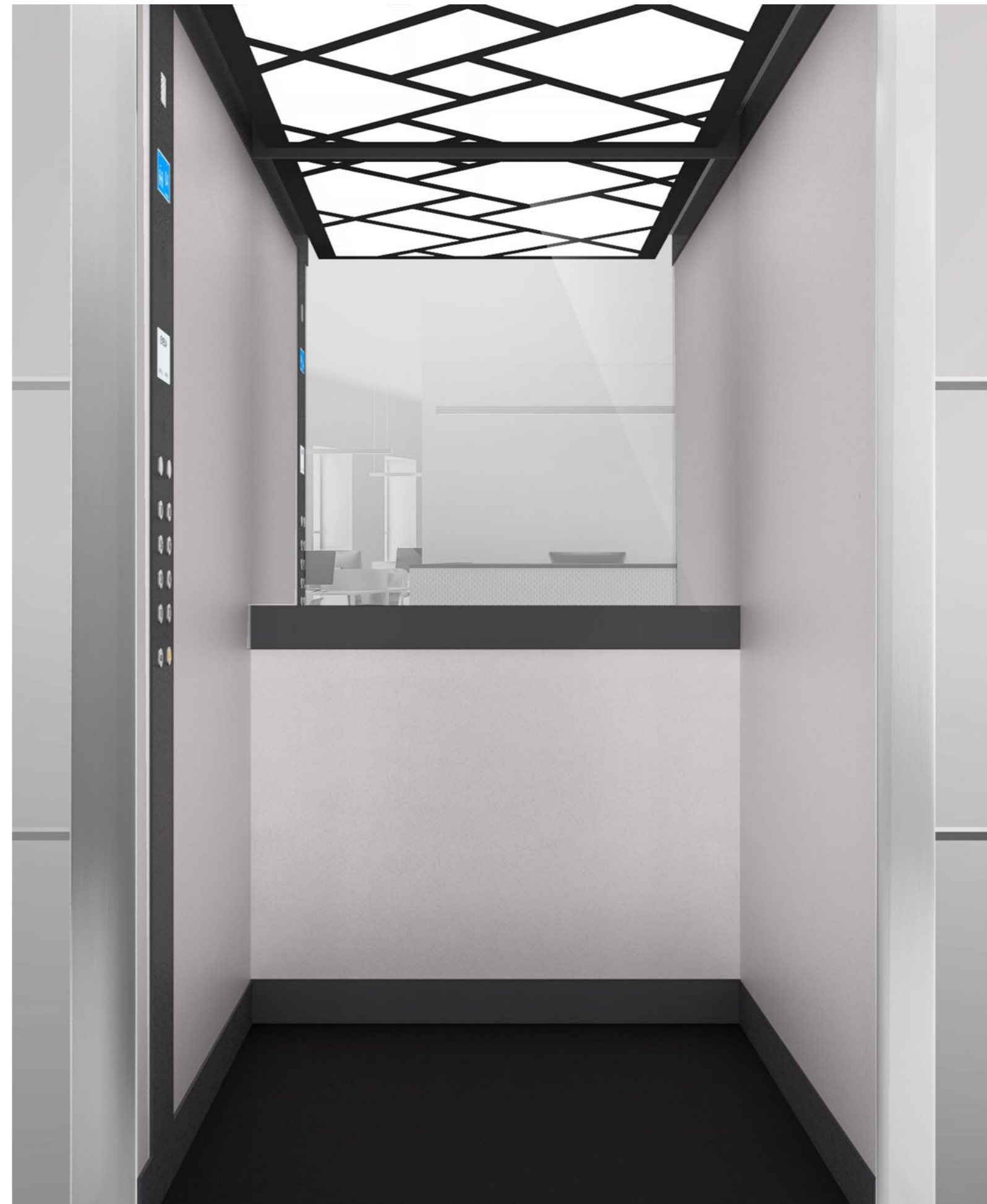
Cabina con acabados incluidos en precio base del modelo. / Cabin with finishes included in the base price of the model.